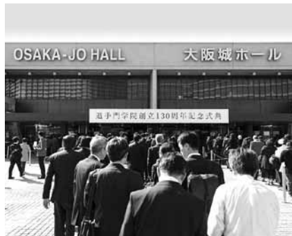
2018年11月7日(水)130周年記念式典

この「卒業生保護者の会会報」第17号で会報の発行を最終とし、今後は学院メールマガジンや卒業生保護者の会ホームページにて情報を配信してまいります。