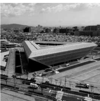
総持寺キャンパス上空写真