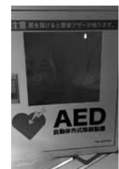
防火防災設備・備品