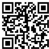
お申し込みフォーム QRコード

〒567-8502 茨木市西安威2-1-15 追手門学院大学総務課 TEL: 072-641-9608 (8/10~8/18は夏期一斉休業のためお電話は繋がりません。) 主催: 追手門学院大学教育後援会 共催: 追手門学院教育振興会