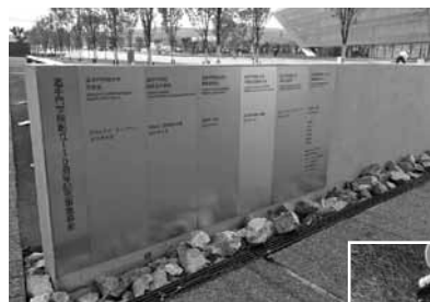
新キャンパス銘板